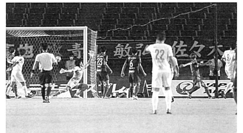
20分、オウンゴールで、C大阪に先制を許す (7/18 C大阪戦、Eスタ)

J: 2020明治安田生命J1リーグ C: 2020YBCルヴァンカップ グループステージ プライムステージ