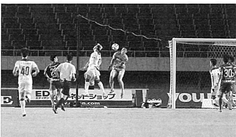
85分、同点に追いつかれる (7/8 同、同)