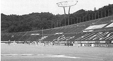
無観客で行われた、広島vs大分 (7/8 同、同)