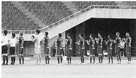
新型コロナと戦う医療関係者などへの感謝の拍手 (7/8 大分戦、Eスタ)

J1リーグは7月27日、「チケットティング」と「ファン・サポーター」に関しては「超厳戒態勢」を8月10日までとしていたガイドラインを31日まで(予定)続けることを発表した。多くのファン・サポーターでスタンドが埋まる「日常」が戻って来ることを期待しながら、まだしばらくはファン・サポーターの「がまん」がつづく。