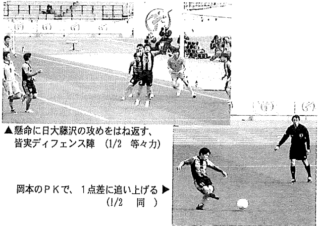
▲懸命に日大藤沢の攻めをはね返す、皆実ディフェンス陣 (1/2 等々力)

決勝 静岡学園(静岡) 3 - 2 青森山田(青森) <静岡学園の優勝は、24大会ぶり2度目>