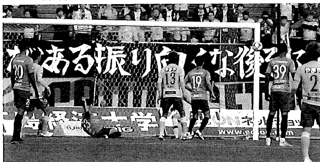
絶体絶命のピンチを荒木◎がカバー、ゴールを許さず (仙台戦、12/7 エディスタ)