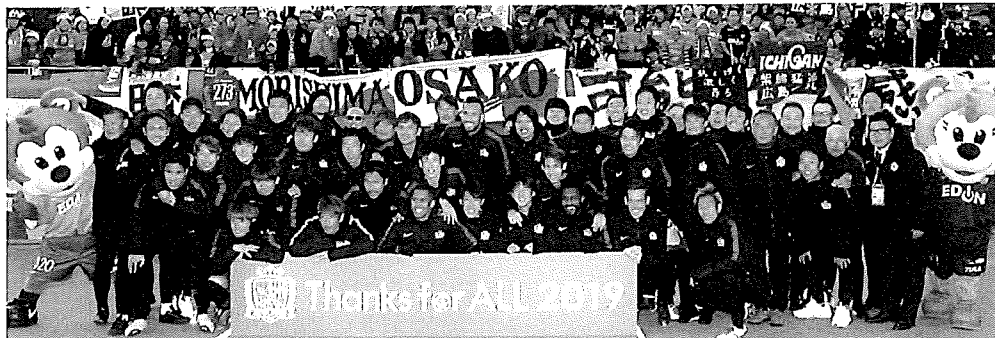
2019シーズンを終えて、サポーターと共に“Thanks for ALL”

明治安田生命2019 J1リーグ、サンフレッチェ広島は、昨シーズンと同様に、波の多いシーズンを送り、6位で終わった。6月からの3か月間は11戦負けなしを記録する。しかし、終盤～最終盤の大切な試合を落したり引き分けたりする“勝負弱さ”の克服はできなかった。しかし、若手の積極的な起用で選手層を厚くし、サッカーの質の向上にもある程度は成功しつつあるように思われ、来シーズンに楽しみが広がっている。